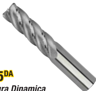
KOR5 DA Fresatura Dinamica Leghe Leggere