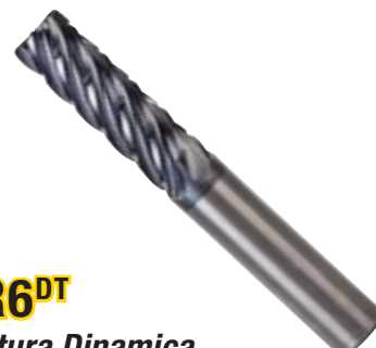
KOR6 DT Fresatura Dinamica Leghe resistenti al calore

Lavorazione ad alta velocità | ProfitMilling® consente di ottenere una riduzione del 75% del tempo di ciclo e un aumento del 500% della durata utensile | ESPRITCAM