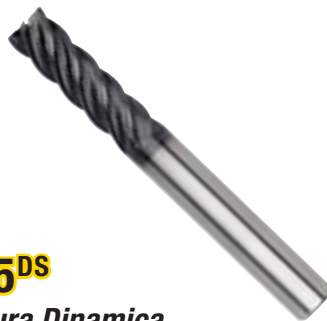
KOR5 DS Fresatura Dinamica Acciaio, Inox, Ghisa