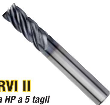
HARVI II Fresa HP a 5 tagli