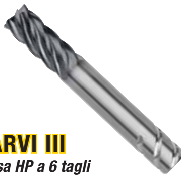
HARVI III Fresa HP a 6 tagli